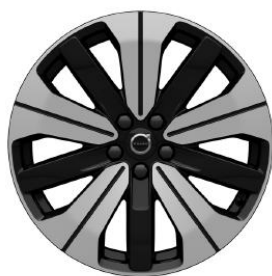
19" Black Diamond