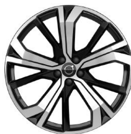
21" Black Diamond