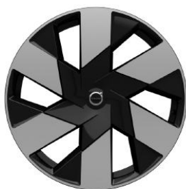
20" Black Diamond