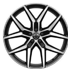
22" Black Diamond