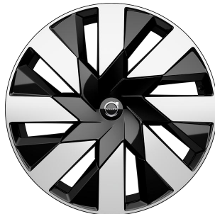
21" Black Diamond