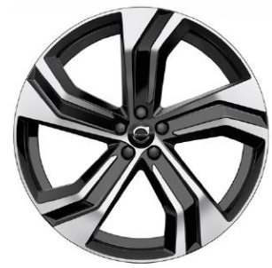
22" Black Diamond