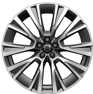
20" Black Diamond